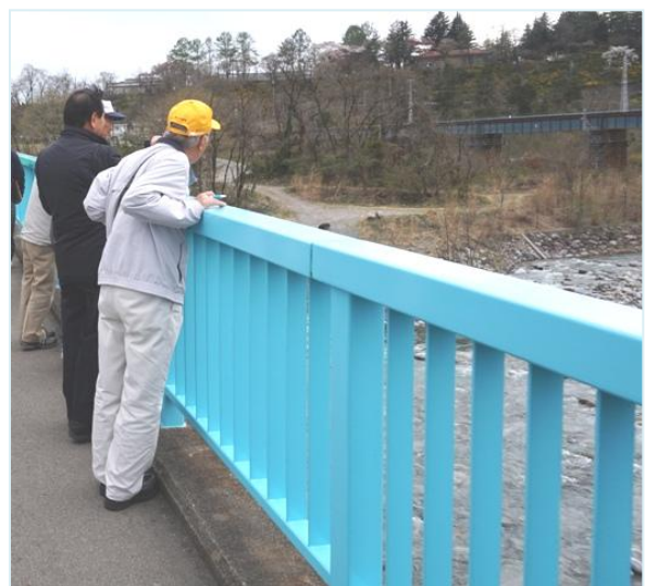
国道 153 号歩道から見た鉄橋