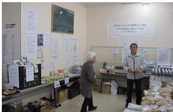
ばとなまつり 2012 での展示：黒ニンニク、発芽玄米、酵素サプリメント、土壌用酵素水、有機肥料、ほか