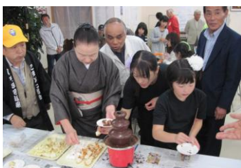
大人気のチョコフォンデュコーナー

10月14日(日)銀座通り及びぱとなで「ぱとなまつり2012」を開催しました。今年のテーマは“みんなで交流 みんなではとな”とし、登録団体や協力団体など20団体が参加して、それぞれの活動に関する展示や販売、パフォーマンスなどを行ないました。毎年子どもに大人気のチョコフォンデュや商連こまがねと共