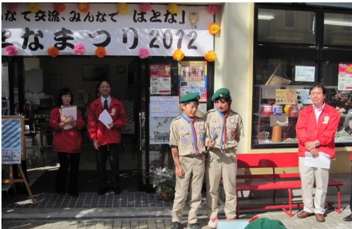
“みんなで交流、みんなではとな” ボーイスカウト駒ヶ根第1団 による「ぱとなまつり2012」開会宣言の様子（H24.10.14）

発行責任者：「ぱとな」登録団体連絡会 事務局：こまがね市民活動支援センター 発行日：平成24年12月1日 電話番号：82-1150 FAX：82-1151 Eメール：kmcenter@oek.ne.jp URL：http://www.patona-k.com