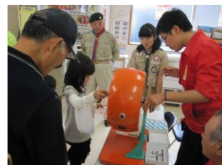
スタンプラリー抽選

催で行なっているスタンプラリーも行ない、大変多くの市民の皆さんにご来場いただき、賑やかに開催することができました。