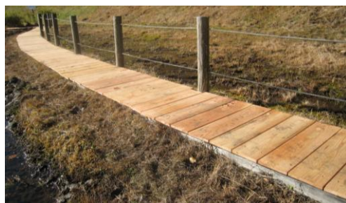
歩きやすくなった木道

ちょっと涼しい天候でしたが、汗をかきながらの作業となりました。今秋季二回目の生息地整備作業は、11月18日(日)午前9時より午後までかかり、会員約18名の参加により、生息地周辺の整備を行いました。6年前に設置した木道の張り替え、フェンス一部移動、枯れたつつじの植