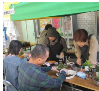
テントブースの様子

閉会式のあと参加者全員で「今日の日にはさようなら」の歌を歌い賑やかだった一日を閉じました。