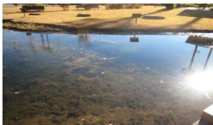
池の邪魔な藻も取り除かれました。

え替え、つつじの枯れる原因とみられる水たまりの配水管埋設等、来年の羽化を期待し、トンボサミットに向け、参加者は力を出し合い、突然出た大きな石に苦戦しながらも、予定した作業はすべて終了しました。