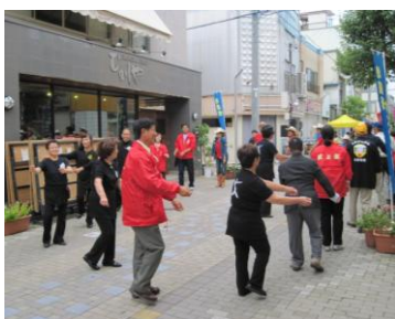
みんな一緒に踊りましょう♪