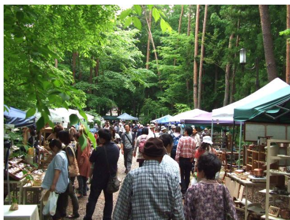
平成24年6月に開催された「くらふていあ杜の市」の様子

今まで、クラフトに接する機会がない方が市内にはたくさんいると思うので、地元で大きなイベントがあるこの機会に、ぜひクラフトにふれて頂いて、手作り品の良さを体験して頂きたいです。