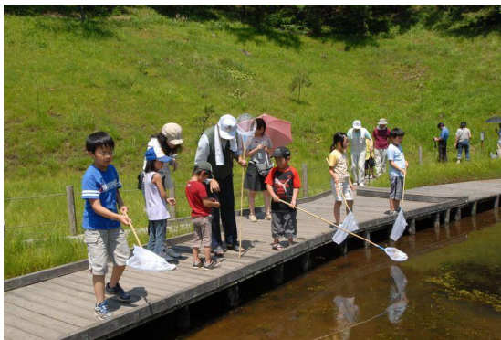
ハッチョウトンボ観察会の様子