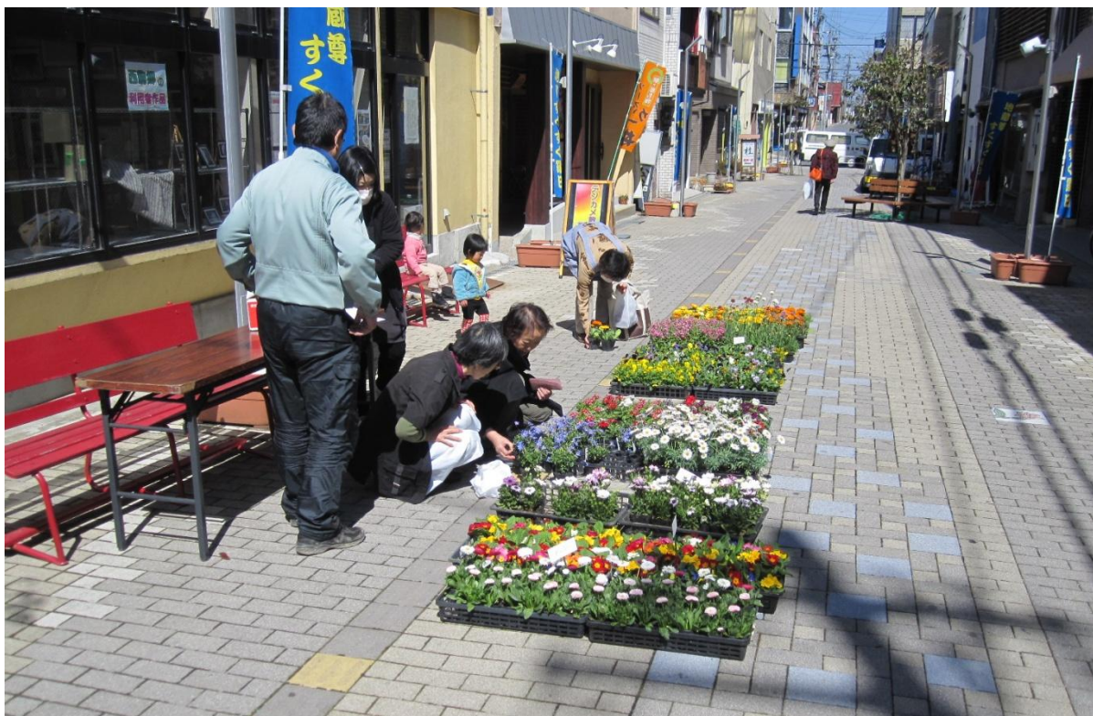
駒ヶ根市銀座商業協同組合「春の花祭り」の様子 (H25.3.15)

発行責任者：「ぱとな」登録団体連絡会 事務局：こまがね市民活動支援センター 発行日：平成25年4月2日 電話番号：82-1150 FAX：82-1151 Eメール：kmcenter@oek.ne.jp URL：http://www.patona-k.com