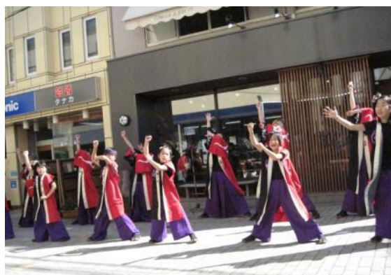
地域で演舞を披露する「縁舞蓮」