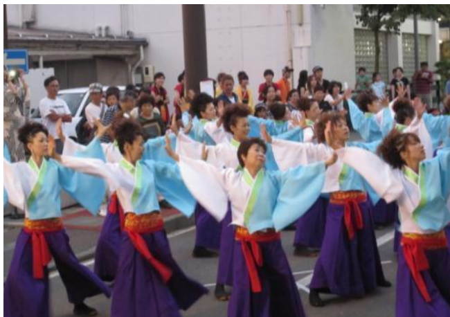
新曲の演舞を披露する「縁舞蓮」

これから寒くなり、発表の場は減ってしまいましたが、練習は毎週行なっています。運動不足で運動したい方、ダイエットしたい方、遠征に行ってみいたい方、ぜひ練習や発表を見学に来て下さい。お待ちしております。