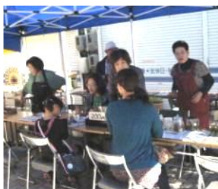
「駒ヶ根花と緑と水の会」のテントの様子