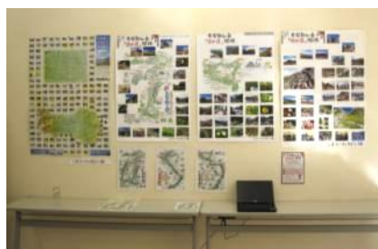
「こまがね探し隊」による展示の様子