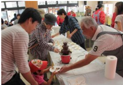
毎年恒例となった大人気のチョコフォンデュコーナー

10月13日(日)銀座通り及びぱとなで「ぱとなまつり2013」をぱとなまつり実行委員会が主催で行ないました。今年もテーマを“みんなで交流 みんなでぱとな”として、登録団体や協力団体などが参加して、それぞれの活動に関する展示や販売、パフォーマンスなど