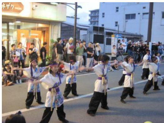
子供達のチーム「呼虎」