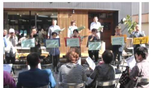
「駒ヶ根歌声喫茶実行委員会」と「はつらつハーモニカ」のメンバー共演による歌声喫茶