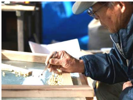
2月1日に長野日報掲載の写真