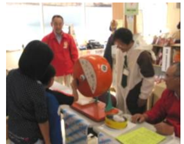
商連こまがねと共催で行なったスタンプラリー抽選会の様子

各団体が日頃の活動の成果を発表し、会場を盛り上げ、市民の皆さんと交流することができた1日でした。