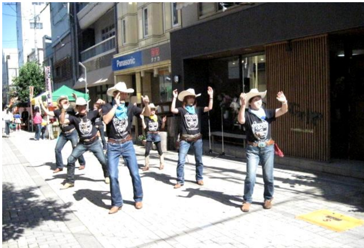
「ぱとなまつり 2013」でダンスを披露する「信州 COUNTRY & WESTERN CLUB」のメンバー (H25.10.13)

発行責任者：「ぱとな」登録団体連絡会 事務局：こまがね市民活動支援センター 発行日：平成25年12月1日 電話番号：82-1150 FAX：82-1151 Eメール：kmcenter@oek.ne.jp U R L：http://www.patona-k.com