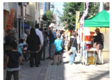
多くの人で賑わう「第26回子育て地蔵尊すくすく縁日」