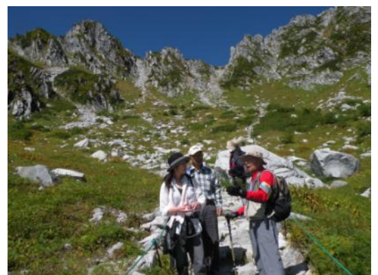
ガイド活動の様子