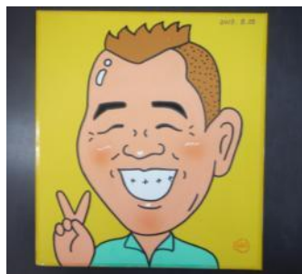
ウド鈴木の似顔絵