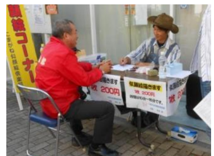
「ぼとなまつり2013」での様子