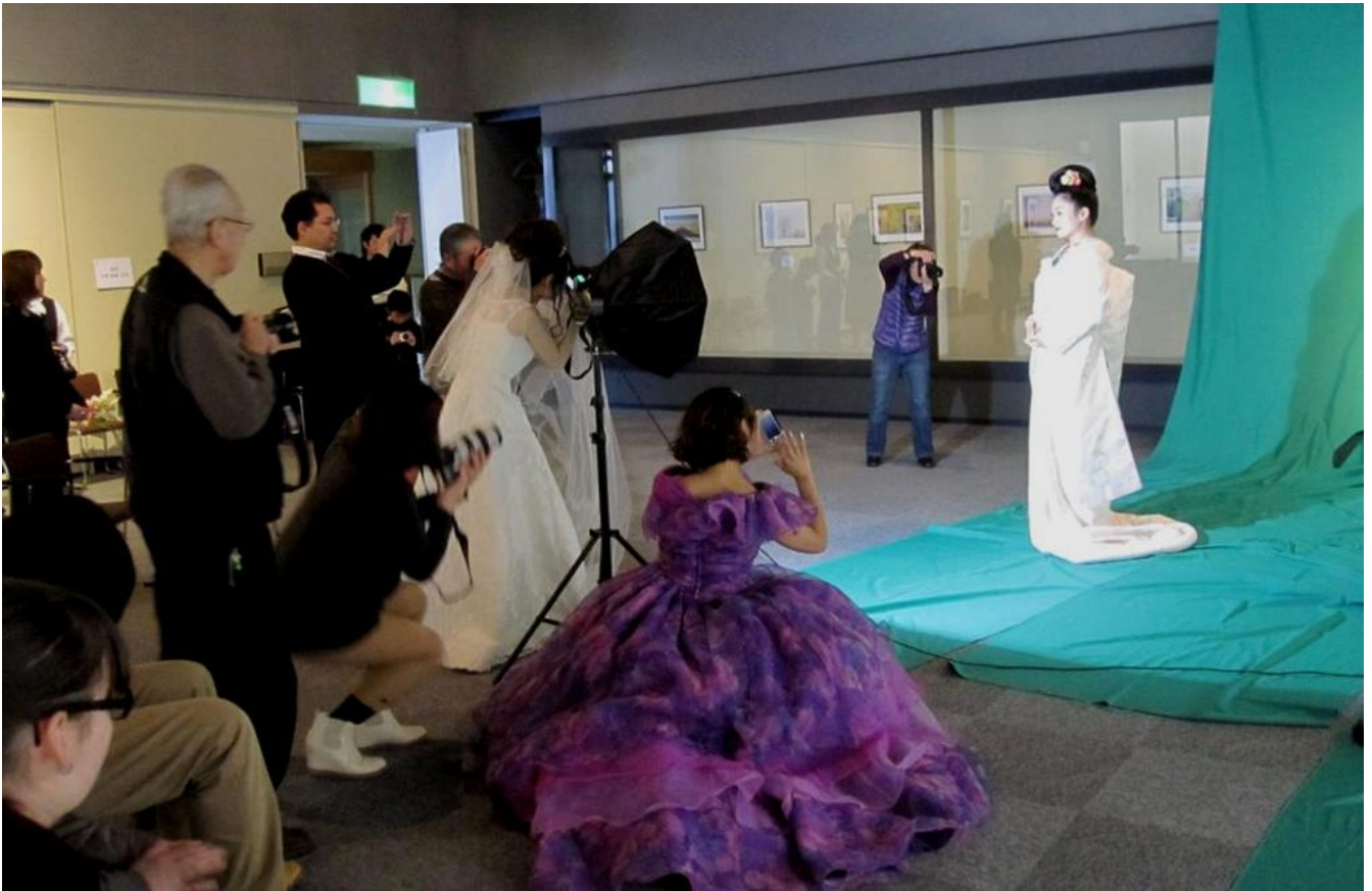
デジカメ教室「風」と風まかせ主催の写真撮影会の様子 (H26. 2. 16)