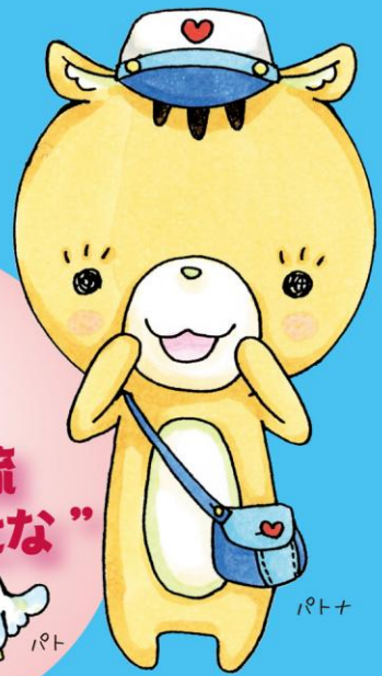
こまがね市民活動支援センター キャラクター・パトナとパト