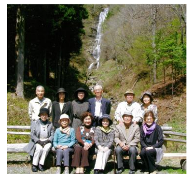
日影水墨画会1日スケッチ旅行

ぜひとも、多くの皆さんに会場へ足をお運びいただき、会員の1年間の精進の成果を鑑賞してくださいませよう、お願い申し上げます。