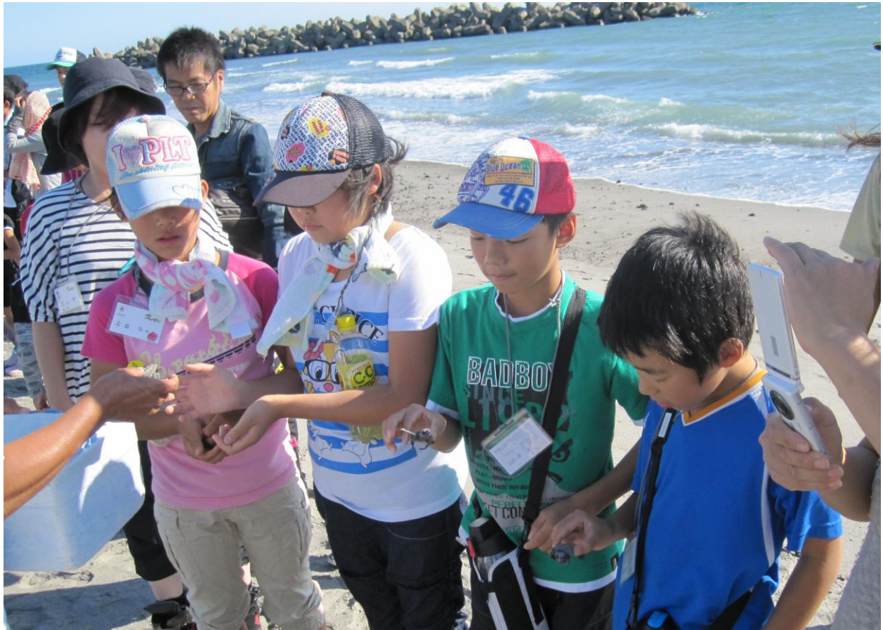
「NPO 法人天竜川ゆめ会議」が主催した遠州灘アカウミガメ放流ツアーで放流するアカウミガメの赤ちゃんを受け取る子ども達の様子

「NPO 法人天竜川ゆめ会議」が9月13日（土）にアカウミガメ放流ツアーを開催しました。65名がツアーに参加し、天竜川の河口がある静岡県の遠州灘に向いました。天竜川の下流や海岸侵食、アカウミガメが捨てられたビニール袋を食べて死んでしまうことなどについて学び、環境に対する意識や上流での暮らしを見直すきっかけとなりました。中田島砂丘ではウミガメの赤ちゃんを1匹ずつ受け取り、海に放流しました。