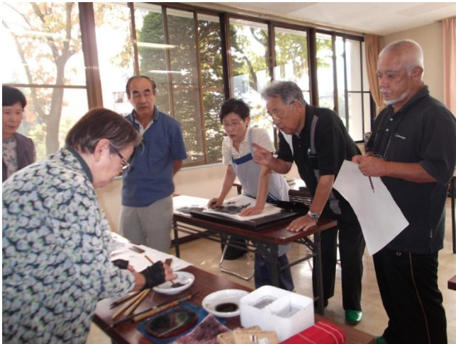
水墨三水会の学習風景