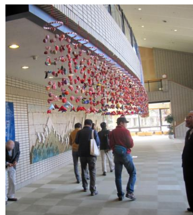
文化センターでの展示