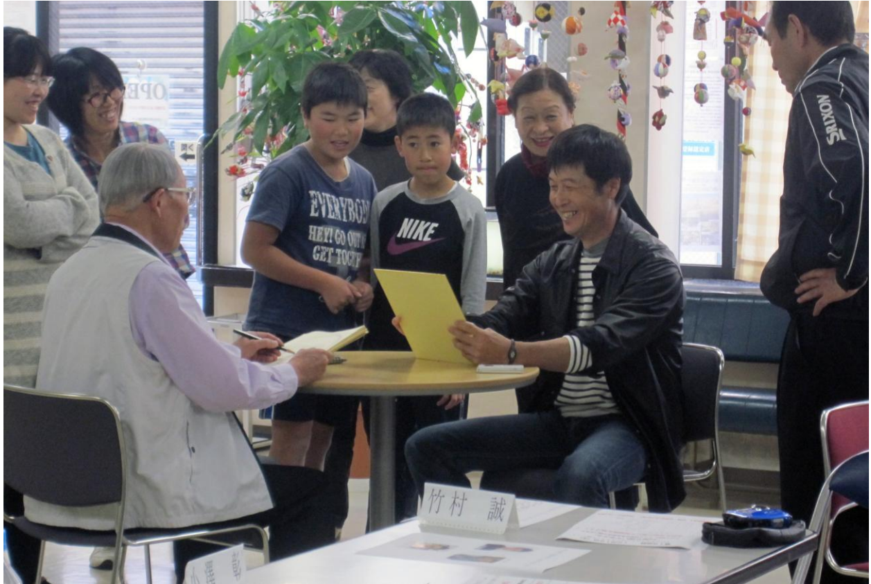
「こまがね似顔絵倶楽部」主催の似顔絵教室の様子

「こまがね似顔絵倶楽部」は平成26年4月から、毎月第2・第4土曜日の10時から、「ぱとな」で似顔絵教室を行なっています。教室には、小学生からご年配の方まで幅広い年齢の方が参加し、毎回、楽しそうに似顔絵を描いて、腕を磨いているようです。