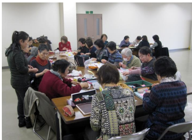
つるし飾り教室の様子