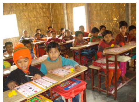
「ナガノ・ダンモルカキンダーガーデン」 で勉強する様子

「遊ぶ未来」 「でいあ・わくみら」への相談・お問い合わせは、長野県国際協力支援センターへお願いします。