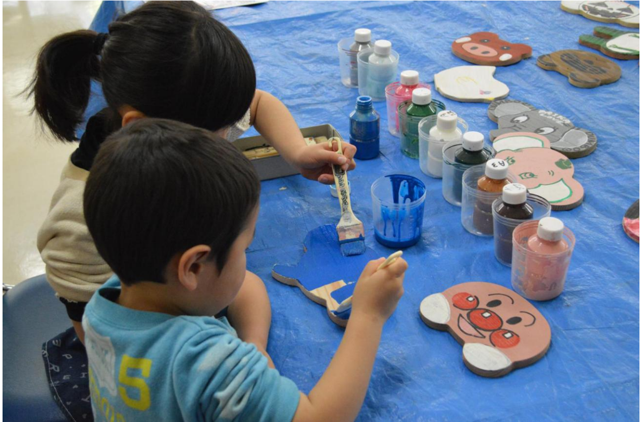
毎月第3日曜日に“あつい！こまがね”が主催する「子育て地蔵尊すくすく縁日」のペイント体験コーナーに参加する子ども達の様子

まちを元気にしようと活動している団体“あつい！こまがね”は、毎月第3日曜日に銀座通りで、「子育て地蔵尊すくすく縁日」を開催しています。縁日には、海産物などの販売や射的などさまざまなテントが並んだり、市内の企業が協力して無料のペイント体験コーナーを行ったりなどしてお子さん達が楽しそうに参加しています。