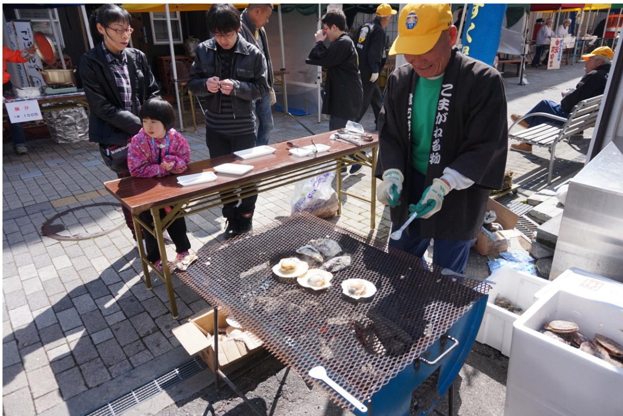
毎月第3日曜日に銀座通りで“あつい！こまがね”が主催する「子育て地蔵尊すくすく縁日」の様子

毎月第3日曜日には、駒ヶ根のまちを元気にしようと活動している団体“あつい！こまがね”が主催する「子育て地蔵尊すくすく縁日」が銀座通りで開催されています。縁日には、赤穂漁協や陸奥湾から直送のホタテやカキなどの新鮮な海産物が焼きたてで味わうことができます。また、お誕生月のお子さん達には、“あつい！こまがね”からケーキのプレゼントも行われて、とても賑わっています。