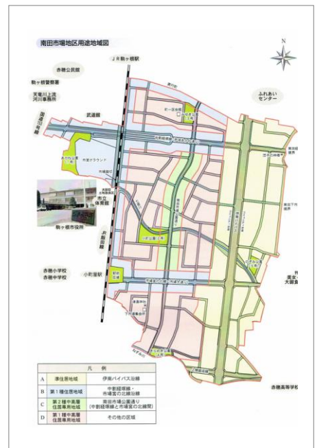
南田市場地区用途地域図

結成以来のメンバーでの運営が続き、若返りが出来ていないことで、少しマンネリ化しています。また、現在の住民協定は過去1回見直しを行っていますが、10年前と少し価値観の違いを感じています。居住感覚も含め、再度若い世代に問いかけ住民協定の改正に向けて取り組んでいきたいと考えています。