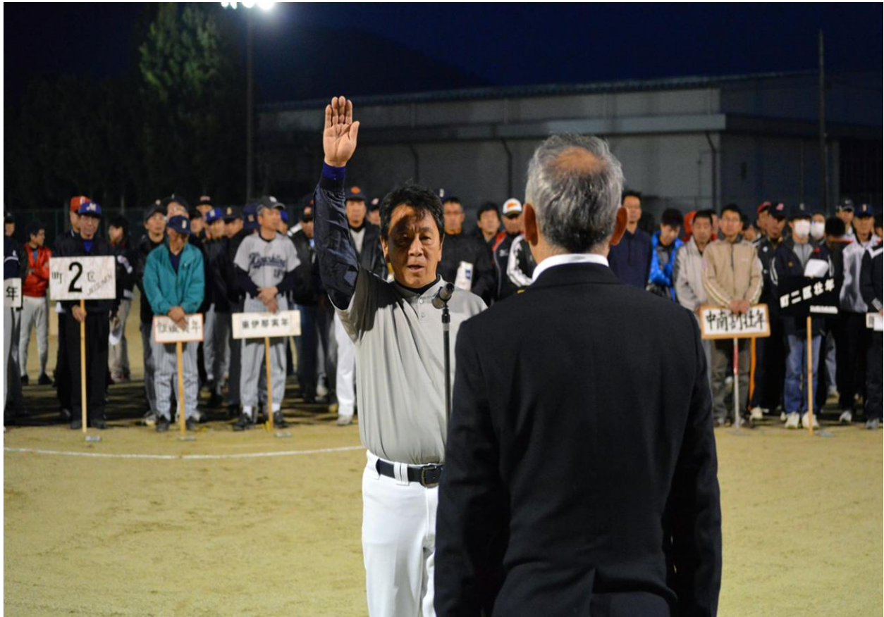
駒ヶ根市壮年ソフトボール連盟のリーグ戦開会式選手宣誓の様子 (H28. 4. 16)

4月16日に駒ヶ根市壮年ソフトボール連盟によるリーグ戦の開会式が市営グラウンドで開催されました。今年度は、壮年の部14チーム、実年の部6チーム、シニアの部10チームの計30チームが登録し、10月初旬まで毎週火・水・土曜日に市営グラウンド、馬住ヶ原グラウンド、丸塚グラウンドの3会場で各部ごとに総当たりのリーグ戦が行なわれます。