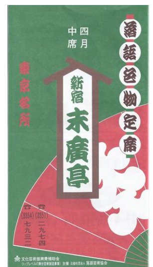
新宿末廣亭 28年4月 パンフレット

二つのアルプスを笑顔文化でつなぐべく、笑顔チャンピオンコンクールや笑顔写真コンテストなどを開催し、えがおポイントを活用して、まちの元気アップの一助にしたいです。また笑いダルマ普及のために「大御笑神社・笑福寺」の建立を目指し、「笑顔まつり」を開催し、やがては日本一のスマイルタウンを実現していきたいと計画しています。賛同される方は是非「さくらのかい」にご参加ください。大望は「笑顔サミット」です。