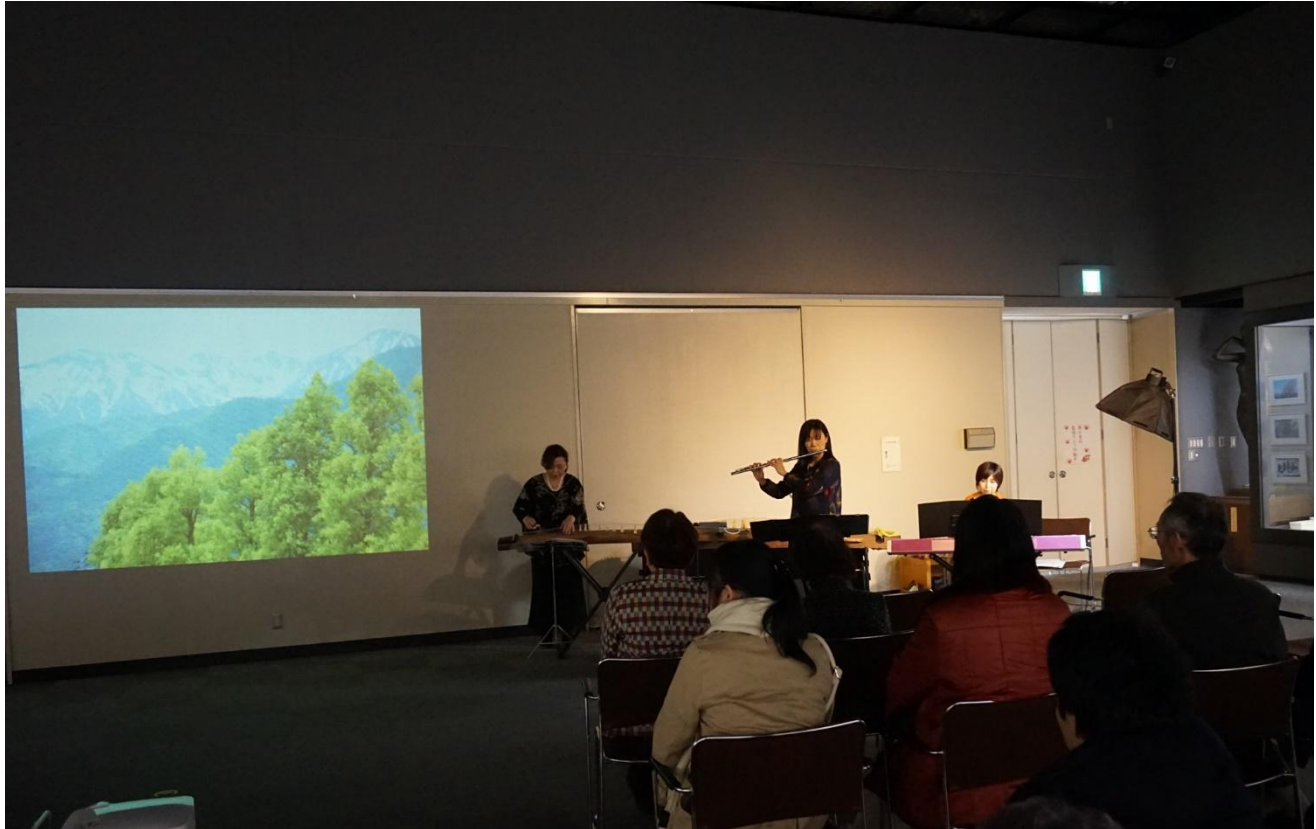
写真クラブ デジカメ教室「風」と風まかせの市立博物館でのライブイベントの様子 (H29. 2. 12)