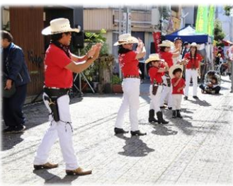
「信州 COUNTRY & WESTERN CLUB」によるダンス披露