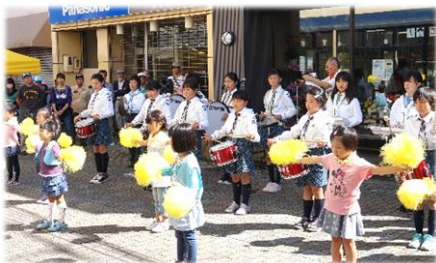
「ガールスカウト長野県第32回」による鼓笛演奏