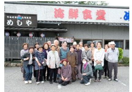
「一人暮らし高齢者の集い」での記念撮影 (H29.10.7)

自分たちが年をとっても安心して暮らしていける地域にしていきたいと考えています。「好い処に住んでいる」「お蔭だよね」と言えるような地域に少しでもしていけるよう「出来ることを、出来る時に、皆で助け合い」をモットーに活動していきたいと思っています。