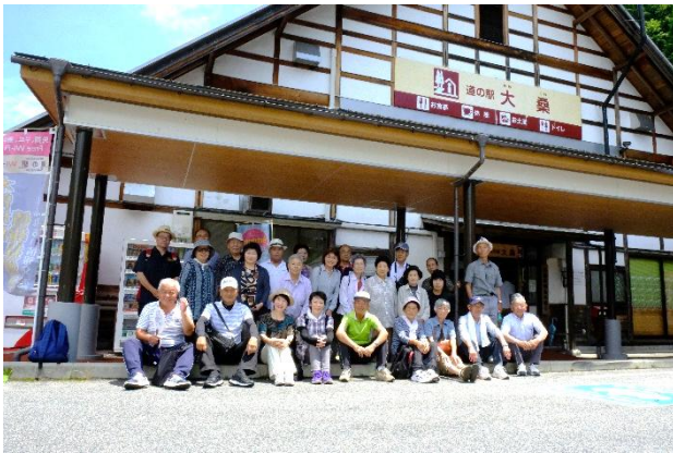
「元気づくり支援事業」バスハイクでの記念撮影 (H29.7.22)