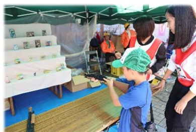
“あつい！こまがね”「子育て地蔵尊すくすく縁日」大人気の射的