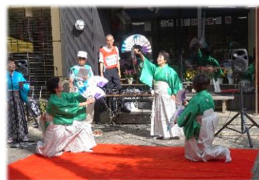
「長野県上伊那岳風会」による扇舞披露