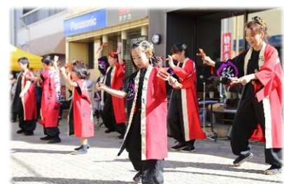
「信州駒ヶ根縁舞蓮」によるよさこいソーランの演舞