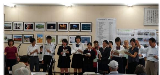
「駒ヶ根歌声喫茶実行委員会」、「はつらつハーモニカ」や高校生と共演の歌声喫茶