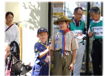
「日本ボーイスカウト長野県連盟駒ヶ根第一団」の団員による開会宣言

10月8日（日）にぱとなまつり実行委員会が中心となり銀座通り及びびばとなで、「ぱとなまつり 2017」を開催しました。今回は8回目の開催で各種団体の皆さんによるパフォーマンスやテント出店、活動発表など盛大に行われました。同時開催の子育て地蔵尊すくすく縁日や商連こまがねと共催のスタンプラリーなど多くの来場者が訪れ、まちなかが賑わいました。