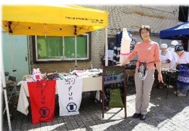
「伊那谷スタイル」によるふんどし「駒FUN」のPR