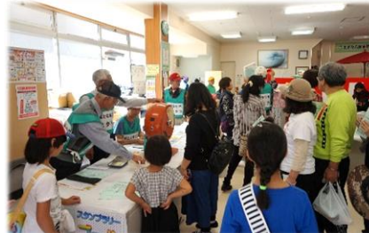
スタンプラリー抽選の様子