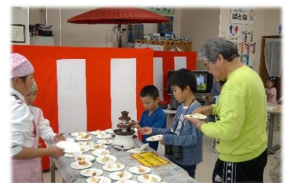
子供も大人も大好き☆チョコフォンデュ♪