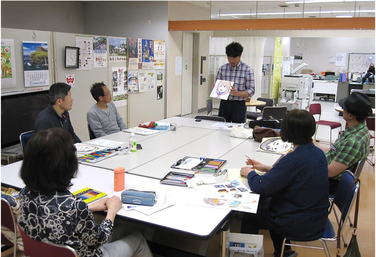
「こまがね似顔絵倶楽部」似顔絵教室の様子（H30.5.19）

「こまがね似顔絵倶楽部」は、土曜日の午前中に月2～3回「ぱとな」で似顔絵教室を開催しています。毎回、会員の皆さんが笑顔で似顔絵教室に参加し、似顔絵の腕を磨いているのは見ていてとても楽しくなります。