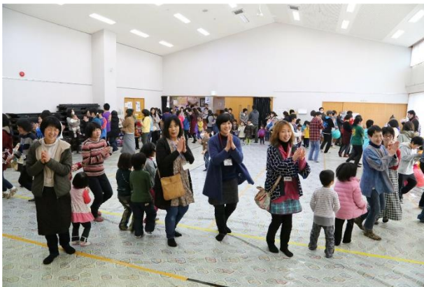
劇場のこどもまつり 締めはみんなでダンス