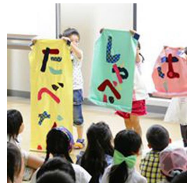
観劇の前の3つのお約束 「たべない・しゃべらない・はしらない」

入会金は家族1,000円で、会費が一人月1,000円です。各種割引もありますので、興味があり詳しくは知りたいという方は、事務局までご連絡ください。