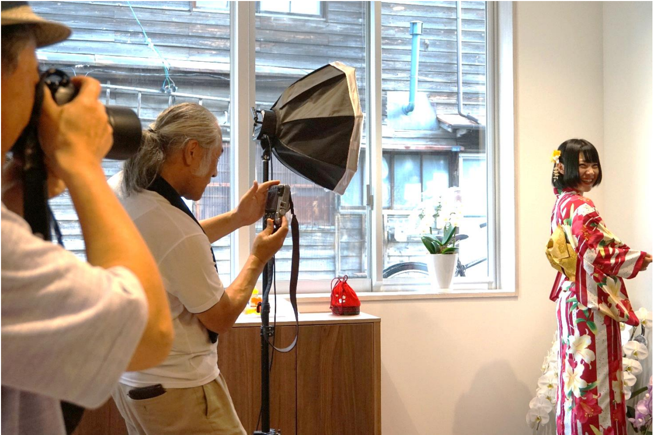
デジカメ教室「風」撮影会の様子 (H30. 7. 14)

デジカメ教室「風」は、7月14日(土)に「ぱとな」で写真撮影会を行いました。当日は、まちなかに祇園祭の宵祭を楽しむ人々が大量訪れ、家族や友人と一緒に写真を撮ってもらおう方がたくさんいました。参加した皆さんからは、「普段記念写真とは違う写真を撮ってもらえてよかった。」と喜んでもらえました。