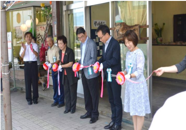
「YandS」オープニングセレモニーの様子