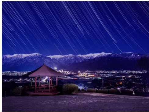
ふるさとの丘とその周辺 「満月の夜景」北澤利一