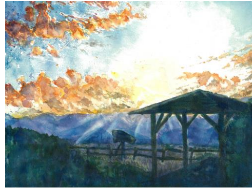
夕陽の丘 「日の入り」和田浩野