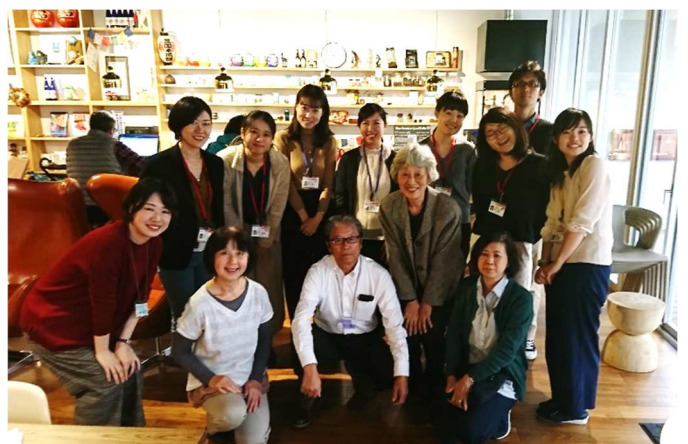
登録団体の方との座談会で、直接ご意見を伺いました

今年度初めて、ぱとなでは青年海外協力隊訓練生の「地域実践授業」を受け入れました。登録団体の皆様にご協力をお願いしました。