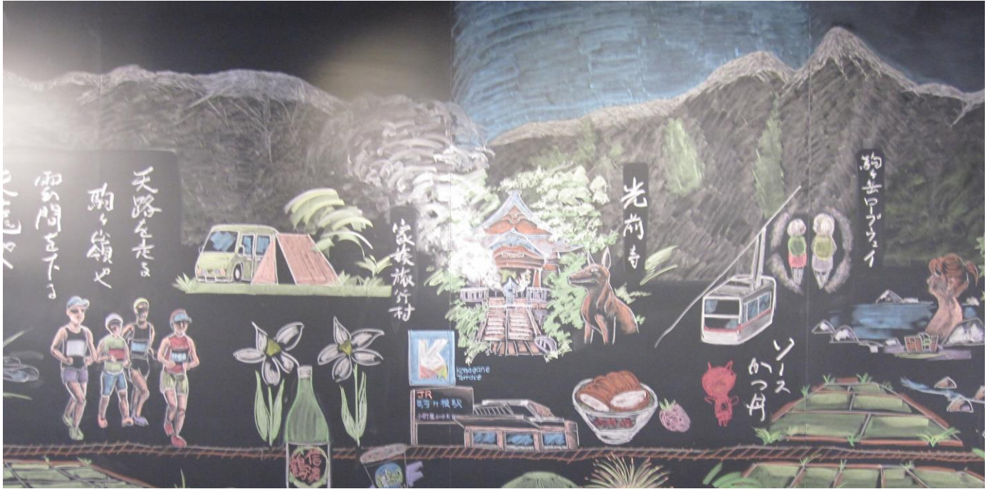
☆ 駒ヶ根の魅力満載!! 展示ギャラリーに描かれたチョークアート ☆

新型コロナウイルス感染症拡大予防対策として「ぱとな」における施設利用・サービス制限、イベント中止、団体活動自粛等皆様には大変ご不便をおかけしています。ご理解ご協力に心より感謝申し上げます。