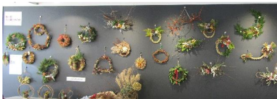
花と緑と水の会 リース展