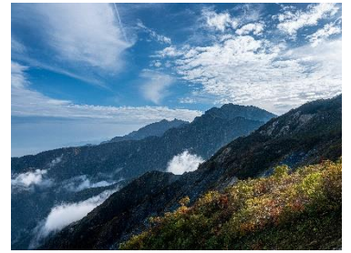
八方尾根から五竜岳

近年コロナ過で思う様な活動が出来ませんでした、連休明けには本格的な活動出来る見込みが立ってきたので、積極的に計画をして、登山を楽しみたいと思います。登山に興味がある方や、日頃運動不足で何かしたいと思っている貴方の参加をお持ちしています。(文：北澤)