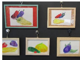
アクアくらぶ 作品展