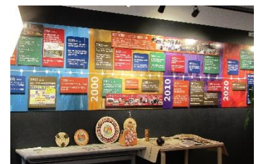
協力隊を育てる会