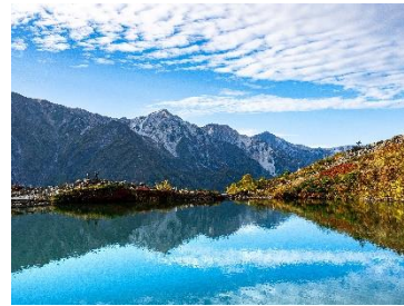
八方池から白馬三山