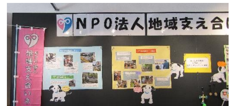
地域支え合いネット