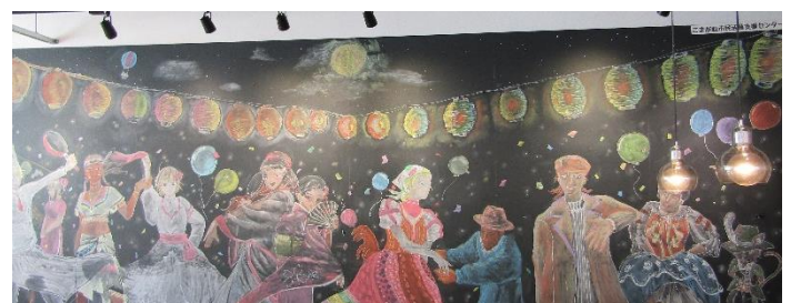
赤穂高校美術部 黒板アート