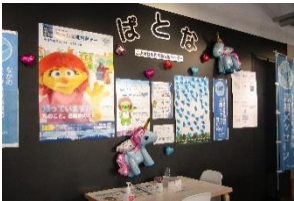
ながの発達障害啓発週間 「結」プロジェクト 世界自閉症啓発デー

昨年度、ぱとなの展示ギャラリーにて、16回の展示が行われました。その作品を紹介します。それぞれ個性豊かな作品で、ぱとなをすてきな空間に彩ってくれました。今年度は、どんな作品が飾られるのか、ご期待ください！！