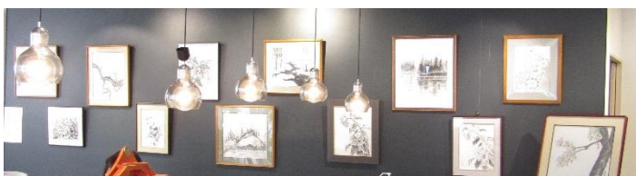
東伊那水墨画教室 作品展