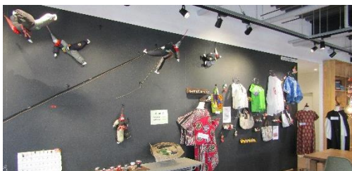
私たちのマチのアーティスト〜第2弾〜針と糸展