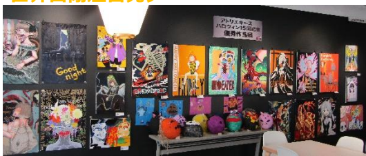
アトリエキース 作品展