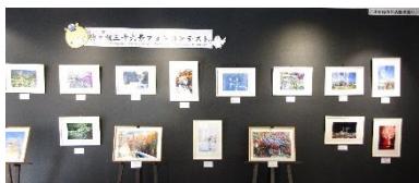
駒ヶ根三十六景フォトコンテスト 入選作品展