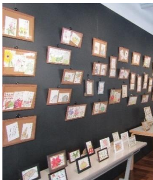
絵手紙つたの会 作品展